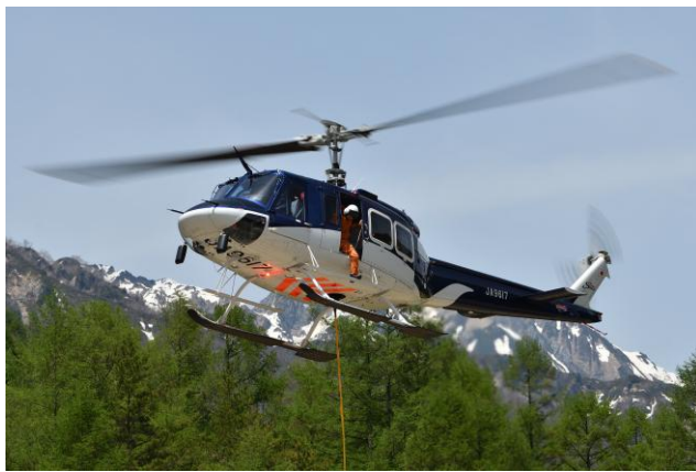
現場作業における ベル式 212 型 Eagle Single