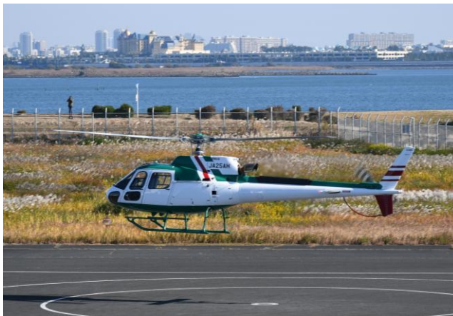
新規導入機の初飛行 エアバス式 H125 型